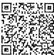
เอกสารที่เกี่ยวข้อง